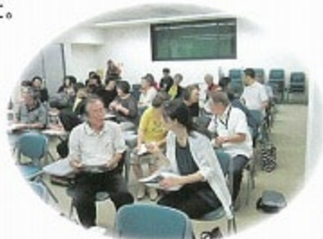
ここに寄り添う聴き方の実践模様

ボランティア活動の啓発とリーダー育成を目的とした「福祉ボランティア代表者会」を9月24日に開催しました。福祉ボランティアに関する講話では、「ここに寄り添うリーダーシップとは?」というテーマで、様々な事例をもとにした講義と2人1組で話し手役、聞き手役の両方を経験する「ここに寄り添う聴き方」を体験し、参加者全員が熱心に取り組みました。