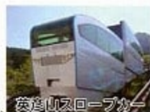
英彦山スロープカー

歴史博物館は平成16年に「伊都国歴史博物館」と名称を変更しリニューアルオープンし古代伊都国の栄華を物語る数多くの考古資料を始め多岐にわたる歴史遺産の保存活用をしております。また、伊都采彩はJA糸島が野菜、果物、花、鮮魚など新鮮な食材を販売する産地直送の農産物直売所です。