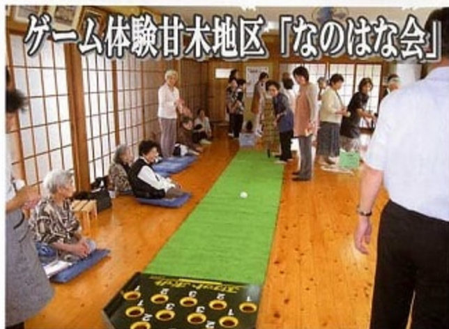
ゲーム体験甘木地区「なのほな会」