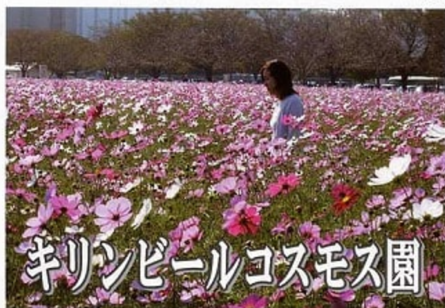
麒麟ビールコスモス園