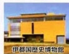
伊都国歴史博物館