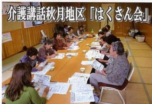
介護講話秋月地区「はくさん会」