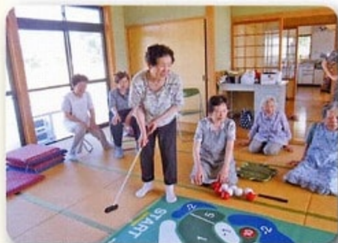
レクリエーション(遊具)