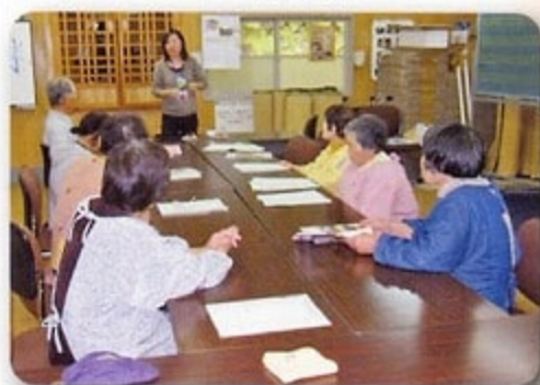
講話(生活安全について)