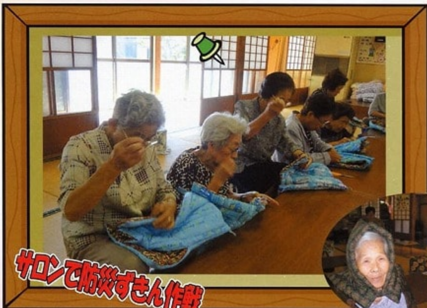
サロンで防災ずきん作戦