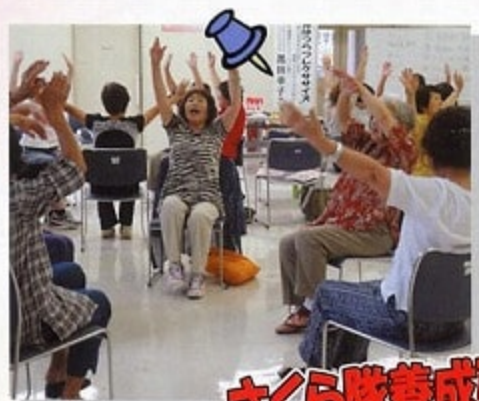
さくら隊養成研修会