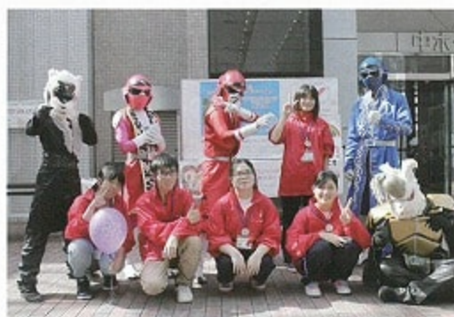
光陽高等学校・朝倉東高等学校・浮羽実業高等学校 朝倉戦隊サンレンジャーの皆さん