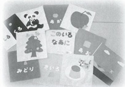
布の絵本「この色なあに」

参加者の中には、完成させた布の絵本を読み聞かせの活動に取り入れてみたいという方もおられ、ボランティア活動の充実に繋がる講座となりました。