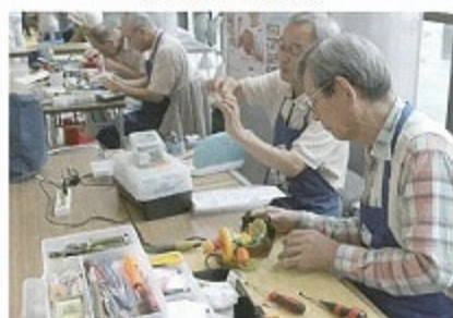
おもちゃドクターの皆さん