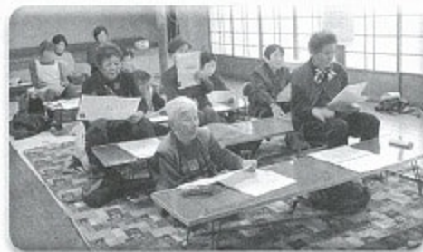
ざと 「おしろいの里」(杷木)