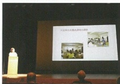
朝倉市手話の会 愛音の会