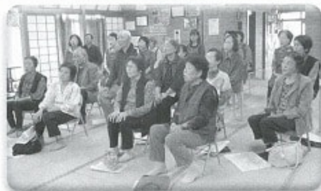
どろう ざとほさか 「泥打ちの里穂坂」(杷木)