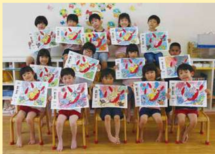
蛭城保育所 つきぐみ