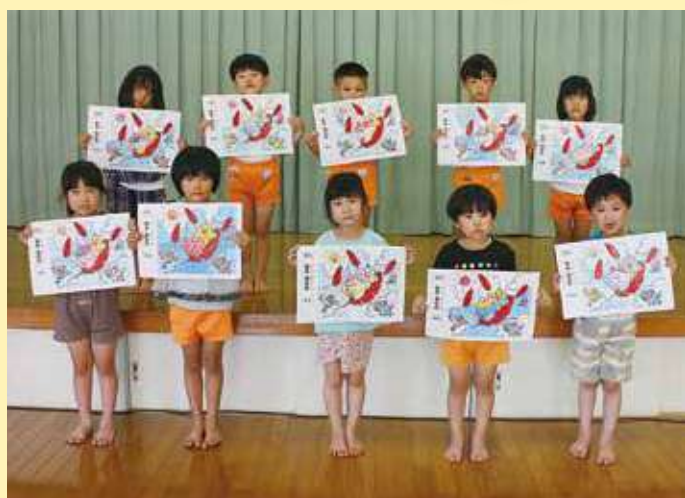
杷木保育所 くまぐみ