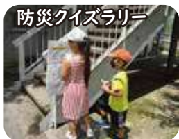
防災クイズラリー