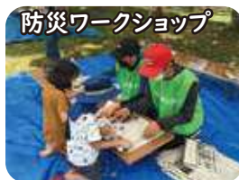
防災ワークショップ