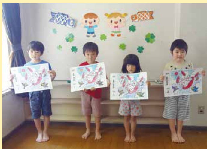
志和保育所 くまぐみ