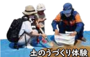
土のうづくり体験

参加者は、もしもの備えとして、さまざまな体験を通して、防災について学ぶ機会となりました。