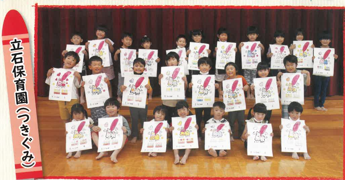
立石保育園（つきぐみ）