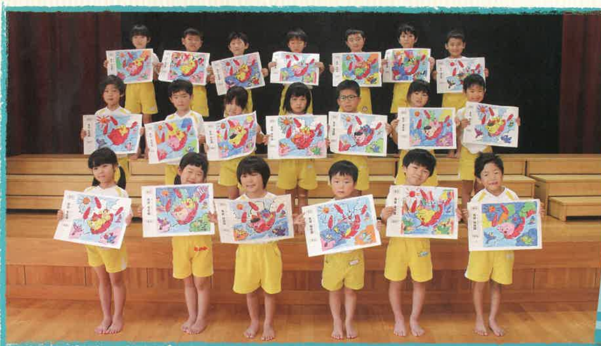
馬田保育園（まつぐみ）

今年も園児のみなさんに「赤い羽根共同募金シンボルキャラクター『愛ちゃんと希望くん』」のぬりえにご協力いただきました。