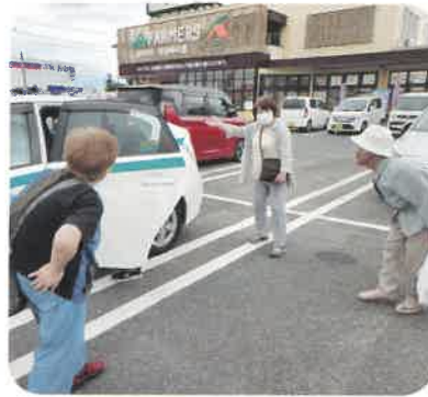
買い物が終わり、Aコープから公民館へ