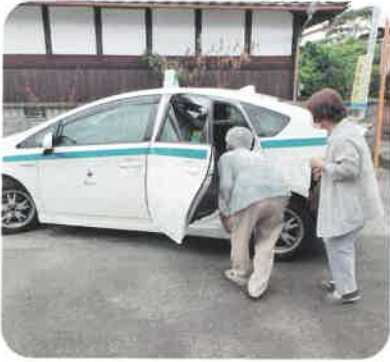
公民館からタクシーに乗り買い物へ出発!

上上浦うめぼし会では、Aコープあまぎ店へ買い物に行くため、あいのりタクシーを体験。買い物へ行く前には、予約方法や時刻表を確認するなど皆さんでしっかりと準備をされていました。