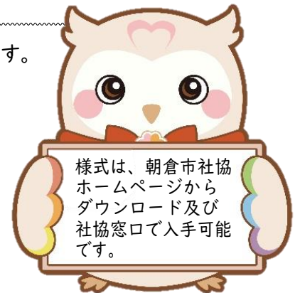
朝倉市社協マスコットキャラクター フクシー

《提出先》 朝倉市社会福祉協議会 福祉課 地域係宛て (朝倉市甘木198-1 ピーポート甘木内)