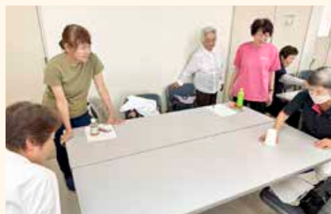
カーリングゲーム (紙コップとゴルフボールを使用)