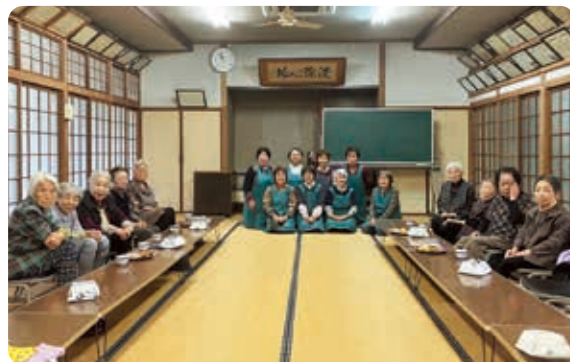
みんなで楽しむ食事会