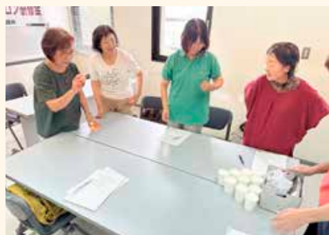
ボールインゲーム (紙コップとピンポン玉を使用)