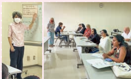
パキスタン・オーストラリア ドイツ・台湾の方が受講中です

このページの申込・お問い合わせ先 朝倉市社会福祉協議会 ☎ (0946) 22-7834