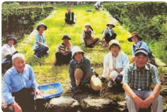
秋月城址、瓦坂の除草作業

秋月は国の重要伝統的建造物群保存地区の選定を受けていて、多くの名所旧跡があります。素晴らしい景観の中で暮らせる幸せを感じながら、会員みんなで清掃活動等しています。